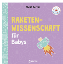
Baby-Universität - Raketenwissenschaft für Babys