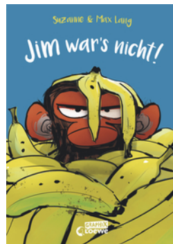
Jim war's nicht!