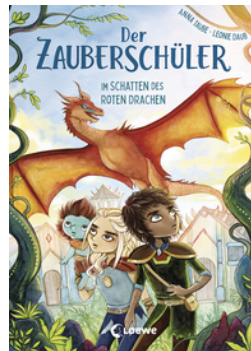
Der Zauberschüler (Band 3) - Im Schatten des roten Drachen