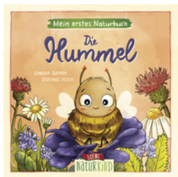
Mein erstes Naturbuch - Die Hummel