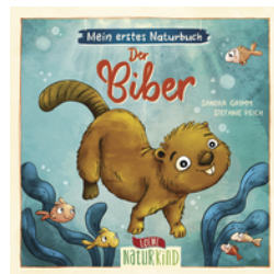
Mein erstes Naturbuch - Der Biber