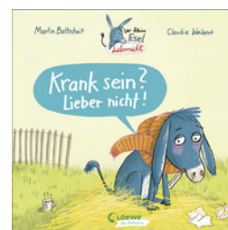
Der kleine Esel Liebernicht - Krank sein? Lieber nicht!