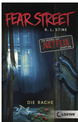
Fear Street - Die Rache