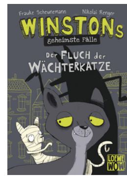
Winstons geheimste Falle (Band 1) - Der Fluch der Wacherkatze