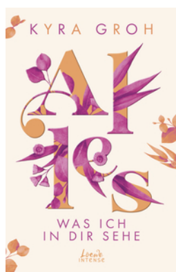
Alles, was ich in dir sehe (Alles-Trilogie, Band 1)