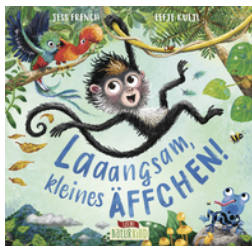
Laaangsam, kleines Äffchen!