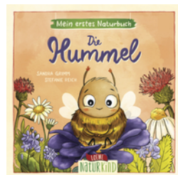
Mein erstes Naturbuch - Die Hummel