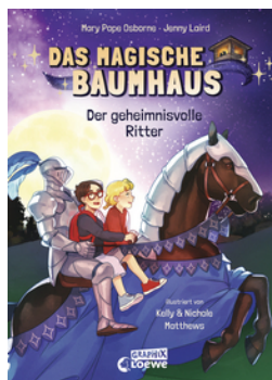
Das magische Baumhaus (Comic-Buchreihe, Band 2) - Der geheimnisvolle Ritter