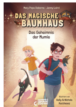
Das magische Baumhaus (Comic-Buchreihe, Band 3) - Das Geheimnis der Mumie