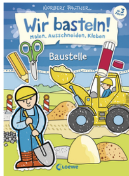
Wir basteln! - Malen, Ausschneiden, Kleben - Baustelle