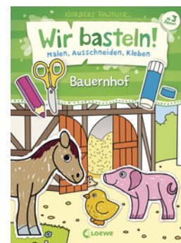
Wir basteln! - Malen, Ausschneiden, Kleben - Bauernhof