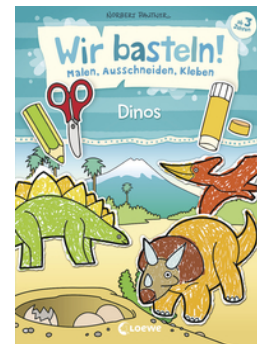
Wir basteln! - Malen, Ausschneiden, Kleben - Dinos