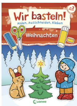
Wir basteln! - Malen, Ausschneiden, Kleben - Weihnachten