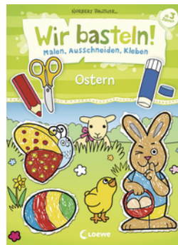
Wir basteln! - Malen, Ausschneiden, Kleben - Ostern