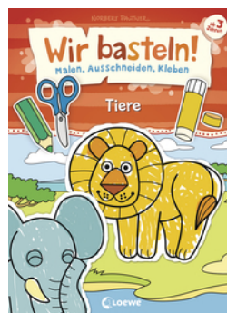
Wir basteln! - Malen, Ausschneiden, Kleben - Tiere