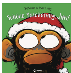
Schöne Bescherung, Jim!