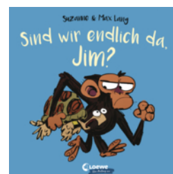
Sind wir endlich da, Jim?