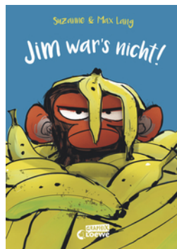
Jim war's nicht!