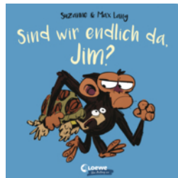
Sind wir endlich da, Jim?