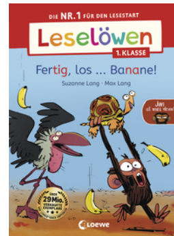
Leselöwen 1. Klasse - Jim ist mies drauf - Fertig, los ... Banane!