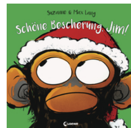
Schöne Bescherung, Jim!