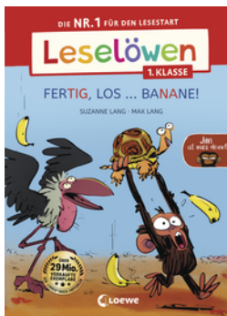
Leselöwen 1. Klasse - Jim ist mies drauf - Fertig, los ... Banane! (Großbuchstaben)