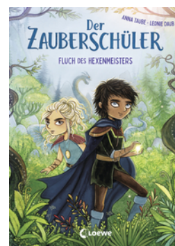
Der Zauberschüler (Band 1) - Fluch des Hexenmeisters