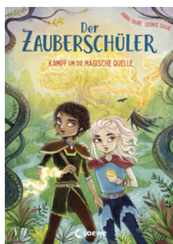
Der Zauberschüler (Band 4) - Kampf um die Magische Quelle