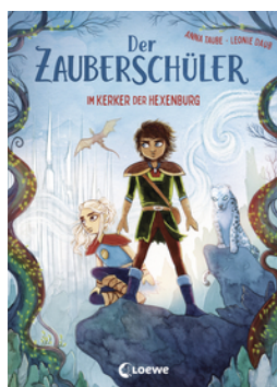
Der Zauberschüler (Band 5) - Im Kerker der Hexenburg