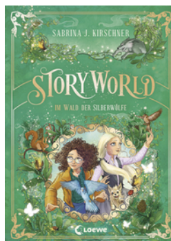
StoryWorld (Band 2) - Im Wald der Silberwölfe