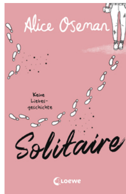
Solitaire (deutsche Ausgabe)