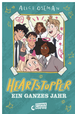
Heartstopper - Ein ganzes Jahr (Yearbook)