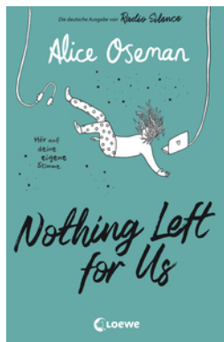
Nothing Left for Us (deutsche Ausgabe von Radio Silence)