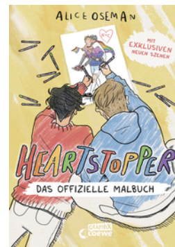
Heartstopper - Das offizielle Malbuch