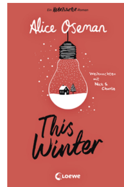
This Winter (deutsche Ausgabe)