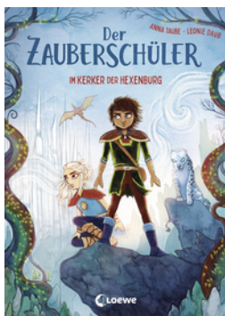
Der Zauberschüler (Band 5) - Im Kerker der Hexenburg