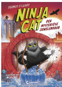
Ninja Cat (Band 4) - Der mysteriöse Juwelenraub