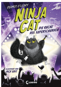
Ninja Cat (Band 3) - Die Rache des Superschurken