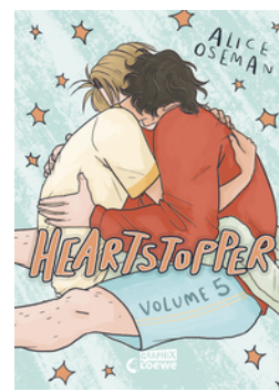
Heartstopper Volume 5 (deutsche Hardcover-Ausgabe)