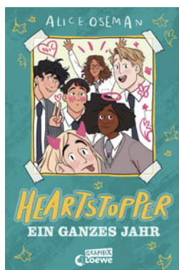
Heartstopper - Ein ganzes Jahr (Yearbook)