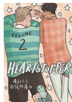
Heartstopper Volume 2 (deutsche Ausgabe)