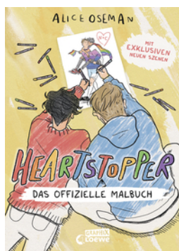
Heartstopper - Das offizielle Malbuch