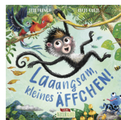
Laaangsam, kleines Äffchen!