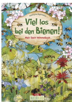
Viel los bei den Bienen!