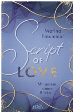
Script of Love - Mit jedem deiner Blicke (Love-Trilogie, Band 2)