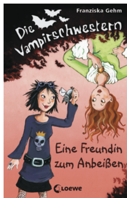
Die Vampirschwestern (Band 1) - Eine Freundin zum Anbeißen