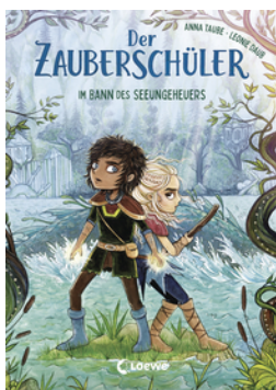
Der Zauberschüler (Band 2) - Im Bann des Seeungeheuers