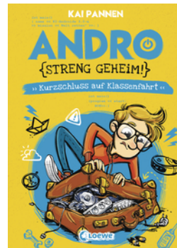
Andro, streng geheim! (Band 3) - Kurzschluss auf Klassenfahrt