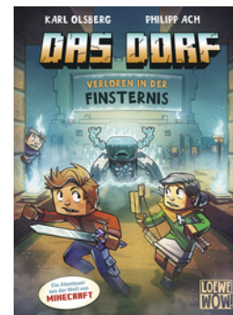
Das Dorf (Band 6) - Verloren in der Finsternis