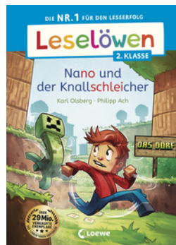
Leselöwen 2. Klasse - Nano und der Knallschleicher