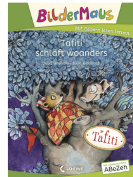
Bildermaus - Tafiti schläft woanders