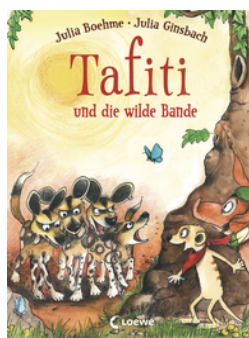
Tafiti und die wilde Bande (Band 20)