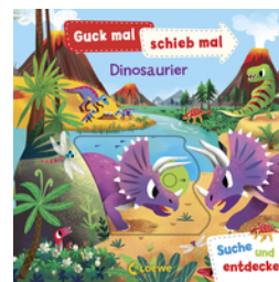
Guck mal, schieb mal! Suche und entdecke - Dinosaurier