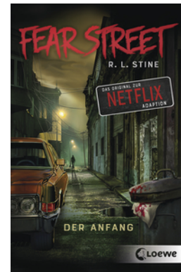
Fear Street - Der Anfang