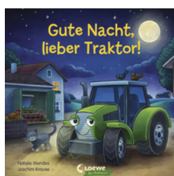
Gute Nacht, lieber Traktor!