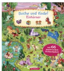
Suche und finde! Einhörner