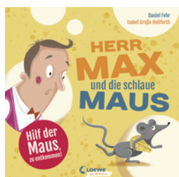
Herr Max und die schlaue Maus