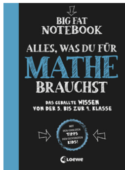
Big Fat Notebook - Alles, was du für Mathe brauchst - Das geballte Wissen von der 5. bis zur 9. Klasse