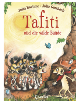
Tafiti und die wilde Bande (Band 20)