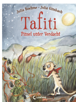
Tafiti (Band 22) - Pinsel unter Verdacht