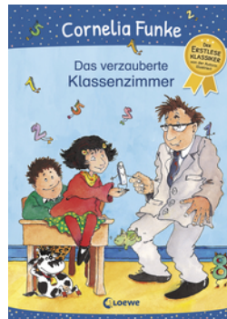
Das verzauberte Klassenzimmer