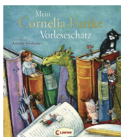
Mein Cornelia-Funke- Vorleseschatz