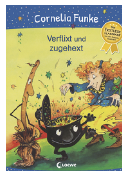
Verflixt und zugehext