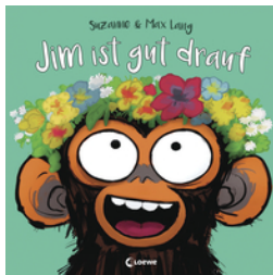
Jim ist gut drauf