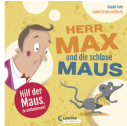
Herr Max und die schlaue Maus