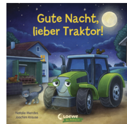
Gute Nacht, lieber Traktor!