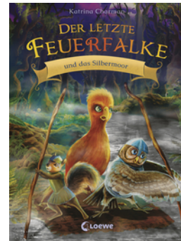
Der letzte Feuerfalke und das Silbermoor (Band 8)