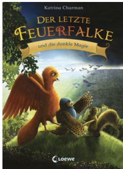
Der letzte Feuerfalke und die dunkle Magie (Band 6)