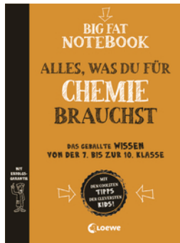
Big Fat Notebook Chemie - Alles, was du für Chemie brauchst - Das geballte Wissen von der 7. bis zur 10. Klasse