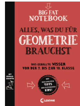
Big Fat Notebook - Alles, was du für Geometrie brauchst