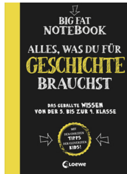
Big Fat Notebook - Alles, was du für Geschichte brauchst