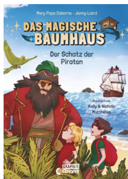
Das magische Baumhaus (Comic-Buchreihe, Band 4) - Der Schatz der Piraten