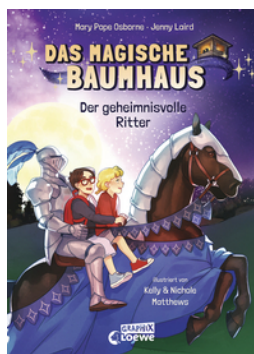
Das magische Baumhaus (Comic-Buchreihe, Band 2) - Der geheimnisvolle Ritter