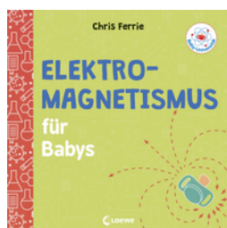
Baby-Universität - Elektromagnetismus für Babys