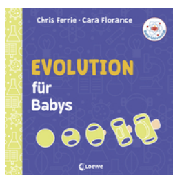
Baby-Universität - Evolution für Babys