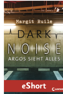
Dark Noise - Argos sieht alles