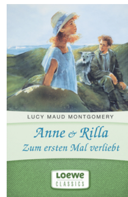
Anne & Rilla - Zum ersten Mal verliebt