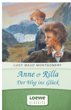
Anne & Rilla - Der Weg ins Glück