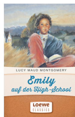
Emily auf der High-School