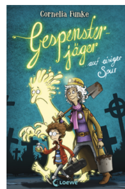
Gespensterjäger auf eisiger Spur (Band 1)