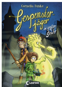
Gespensterjäger in großer Gefahr