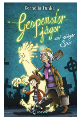
Gespensterjäger auf eisiger Spur