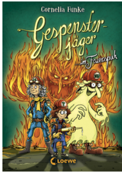
Gespensterjäger im Feuerspuk (Band 2)