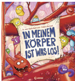
In meinem Körper ist was los!