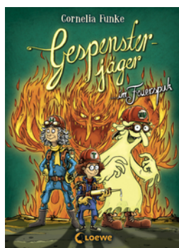
Gespensterjäger im Feuerspuk