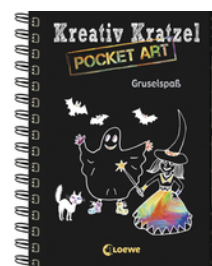
Kreativ-Kratzel Pocket Art: Gruselspaß