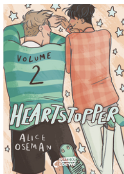
Heartstopper Volume 2 (deutsche Ausgabe)