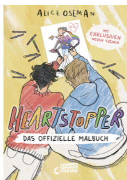
Heartstopper - Das offizielle Malbuch