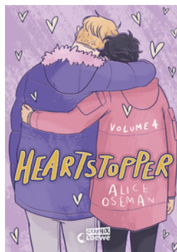
Heartstopper Volume 4 (deutsche Hardcover-Ausgabe)