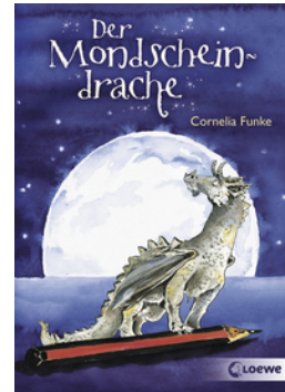
Der Mondschein- drache

... und 37 weitere Titel des Autors vorhanden.