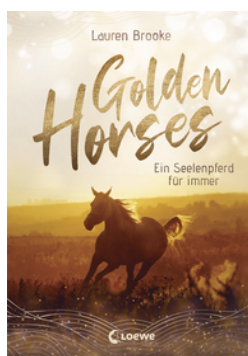
Golden Horses (Band 1) - Ein Seelenpferd für immer