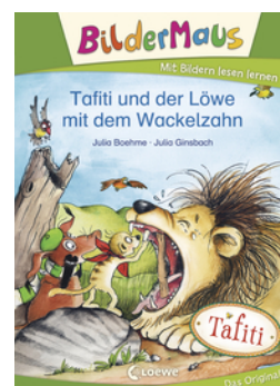
Bildermaus - Tafiti und der Löwe mit dem Wackelzahn