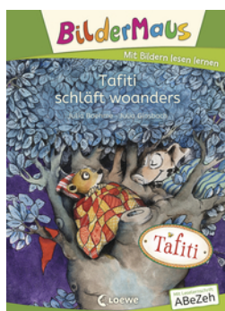
Bildermaus - Tafiti schläft woanders