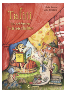
Tafiti - Die schönsten Vorlesegeschichten