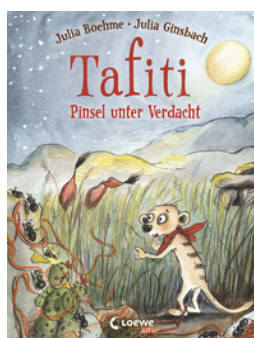
Tafiti (Band 22) - Pinsel unter Verdacht