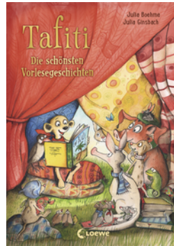
Tafiti - Die schönsten Vorlesegeschichten